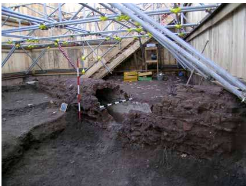
Fig. 2. Piazza Vittorio Emanuele II. Particolare del canale di deflusso ottocentesco.

La rapidità delle demolizioni di quegli anni causò caotici sbancamenti, che determinarono nella Piazza Vittorio Emanuele un abbassamento del piano di campagna di tre metri 5 . Anche nel quadrante meridionale della piazza questa situazione, posta in luce dalle nostre indagini, appare confermata dalla natura e dalla potenza degli strati di accumulo, formati da una serie fittissima di rampe sovrapposte costituite dal continuo scarico delle macerie di strutture antiche, demolite inevitabilmente nella costruzione del nuovo quartiere. Così pure alla sistemazione ottocentesca del giardino può essere attribuito il tratto in muratura rinvenuto, pertinente ad un canale fognario, costruito con scapoli e scaglie di tufo legati da una tenace malta pozzolanica 6 . Al centro della piazza umbertina vi era un laghetto: la parte della canalizzazione di deflusso apparteneva certamente al suo impianto di smaltimento delle acque (fig. 2).