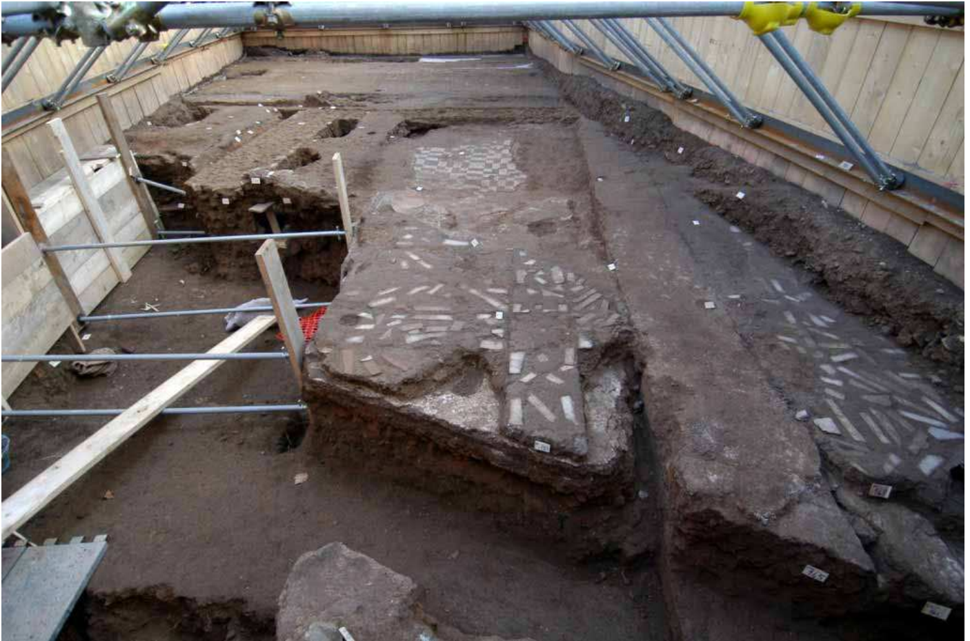
Fig. 13. Piazza Vittorio Emanuele II. Preparazione di un pavimento in opus sectile a grande modulo.