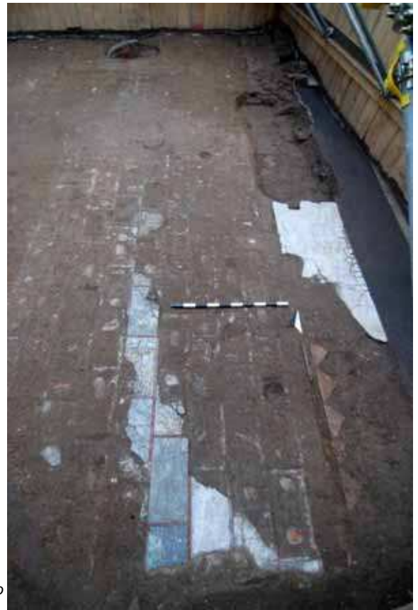
Fig. 12. Piazza Vittorio Emanuele II. Pavimento in opus sectile con lastre di greco scritto e listelli in rosso antico.

a L. Nell'area occupata precedentemente dagli ambienti A1, A2, A3 e B fu realizzato quindi un grande ambiente 78 del cui pavimento, in opus sectile con modulo di grande formato, si conservavano solo le impronte (fig. 13).