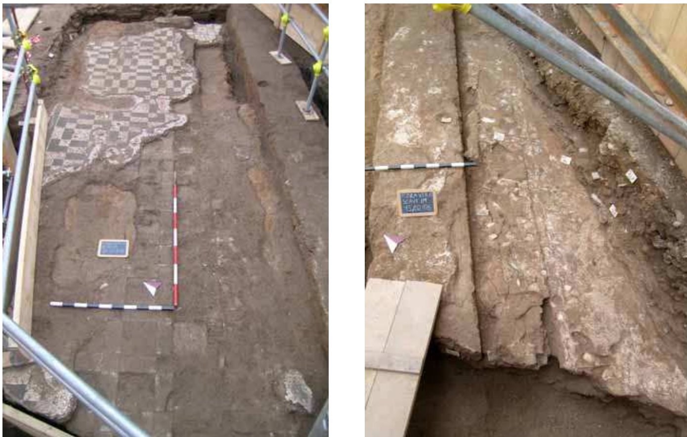
Figg. 9-10. Piazza Vittorio Emanuele II. A sinistra preparazione di un pavimento in opus sectile oblitterato da un mosaico geometrico; a destra preparazione di un pavimento in opus sectile con particolare delle impronte.

Nell'ambito di questi interventi si decise di pavimentare in opus sectile anche l'area fin qui rimasta all'esterno del complesso (fig. 5, B), dopo aver innalzato la quota fino a quella dei pavimenti interni (fig. 10). La continuità del pavimento sui lati sud ed ovest del complesso lascia ipotizzare l'esistenza di un'area pavimentata affacciata verso valle ed esposta a mezzogiorno: si trattava dunque di un'area, forse porticata, dal forte impatto scenografico.