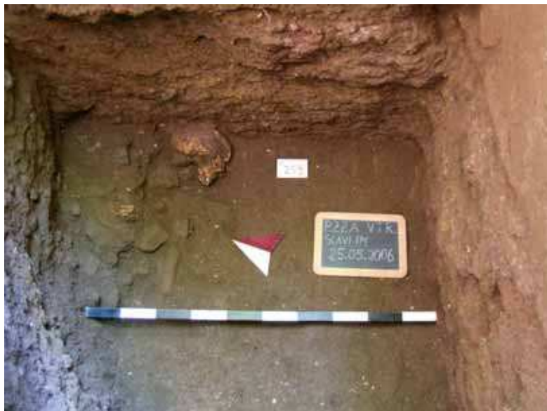
Fig. 6. Piazza Vittorio Emanuele II. Abbandono della necropoli sconvolta dalla bonifica di Mecenate.

La destinazione dell'area cambiò radicalmente negli ultimi anni dell'età repubblicana quando, con la bonifica mecenaziana (42-38 a.C.), la necropoli venne interrata e la zona caratterizzata da un fiorire di ville, parchi, ninfei e padiglioni. E' in questo momento che si ha il primo impianto del padiglione degli Horti , le cui poderose fondazioni poggiano in parte sulla rasatura dei puticuli e in alcuni casi arrivano direttamente sul banco di tufo sopra descritto. Negli