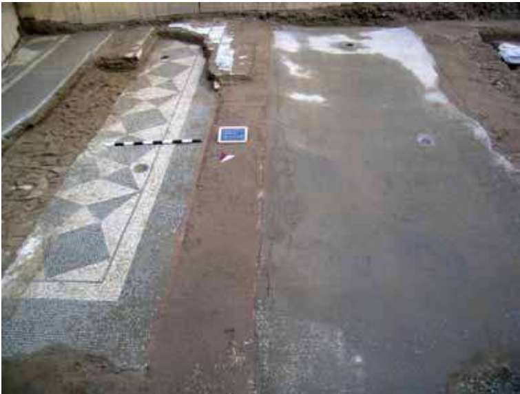
Fig. 11. Piazza Vittorio Emanuele II. Settore est dello scavo. A destra mosaico monocromo, a sinistra mosaico geometrico.