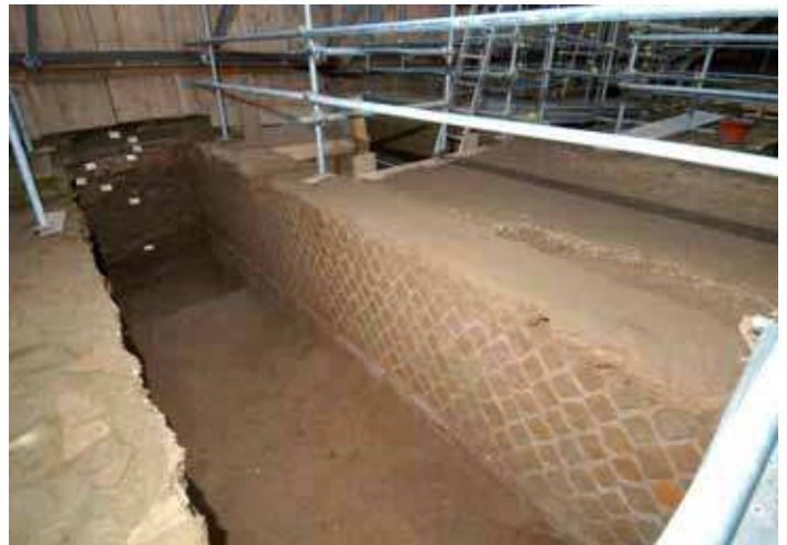
Figg. 7-8. Piazza Vittorio Emanuele II. Prospetto e foto del paramento esterno del corridoio verso est (documentazione grafica Impresa Silenzi).

Anche in questo caso il pavimento si attestava ad una quota superiore rispetto al piano di campagna. Il livello fu rialzato attraverso uno spesso interro, ricco di materiali. Il paramento interno non è più visibile a causa dell'azione di demolizione cui si è già accennato.