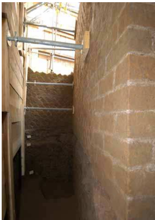
Fig. 4. Piazza Vittorio Emanuele II. Particolare dello spiccatto di una struttura muraria affacciata verso ovest.

Ai dati sulla morfologia del suolo in questo punto dell'Esquilino, acquisiti nel corso degli scavi condotti nel 2002 29 , si può aggiungere che la movimentata articolazione orografica dell'area, è comprovata dall'aspetto delle murature antiche le cui fondazioni spiccano a quote differenti (figg. 3-4) In particolare, assecondando il naturale declivio del terreno, imponenti muri con paramento esterno in opera reticolata con funzione sostruttiva, individuavano ambienti disposti su terrazze su cui si articolava l'edificio fondato su un pianoro e proteso verso la valle: i lussuosi complessi residenziali concepiti in ambito tardo-repubblicano e primo-imperiale con padiglioni distribuiti nel verde di un giardino, articolati su terrazzamenti naturali o artificiali, si rivolgono a modelli architettonici tipici dei complessi di tradizione ellenistica 30 . Una stimolante ricostruzione topografica degli Horti Lamiani secondo una disposizione a terrazze è già stata proposta da M. Cima, con richiamo ai principali esempi di "architettura di paesaggio" sia in ambito greco-ellenistico che romano 31 .