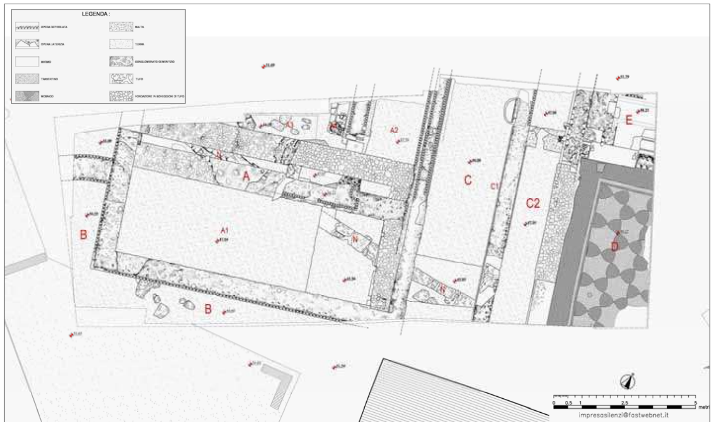
Fig. 5. Piazza Vittorio Emanuele II. Planimetria dell'area di scavo, con indicazione degli ambienti (Documentazione grafica Impresa Silenzi).

Su di un'area di circa 160 mq, il susseguirsi di interventi di ristrutturazione e di riorganizzazione degli spazi, segnala non solo i cambiamenti di gusto o di mode scanditi dai passaggi di proprietà degli Horti , ma anche cedimenti strutturali in più casi rivelati da segni di lesioni antiche sui livelli pavimentali (fig. 5). I fenomeni di debolezza strutturale dovuti alla presenza di cavità quasi certamente sono riconducibili alla presenza nel sottosuolo di resti della necropoli. Sono state individuate almeno sei fasi di attività tra gli ultimi decenni del I secolo a.C e l'età tardoantica nelle quali vennero riorganizzati e ripavimentati gli ambienti 32 .